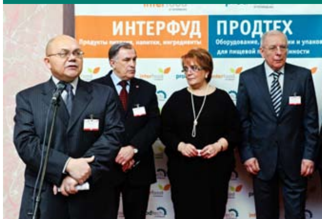
В приветственном слове к участникам и посетителям была особо отмечена важность выставок «ИНТЕРФУД» и «ПРОДТЕХ» в формировании качественного и стабильного продовольственного рынка Северо-Западного региона.