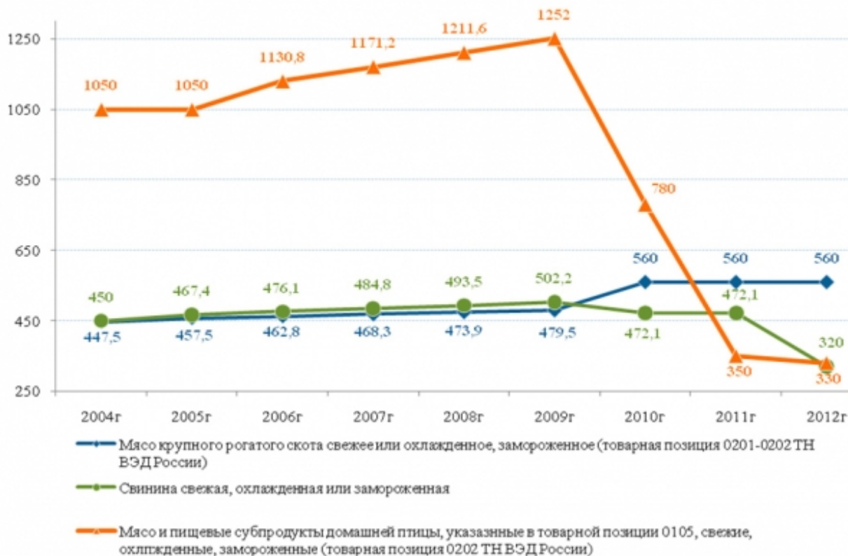
График 1. Динамика объема тарифных квот с 2004 года по 2012 год на мясо в разрезе товарных групп, тыс. тонн

Объем тарифных квот на 2012 год указан исходя из постановления Правительства Российской Федерации от 27 июля 2011 г. N 616 г